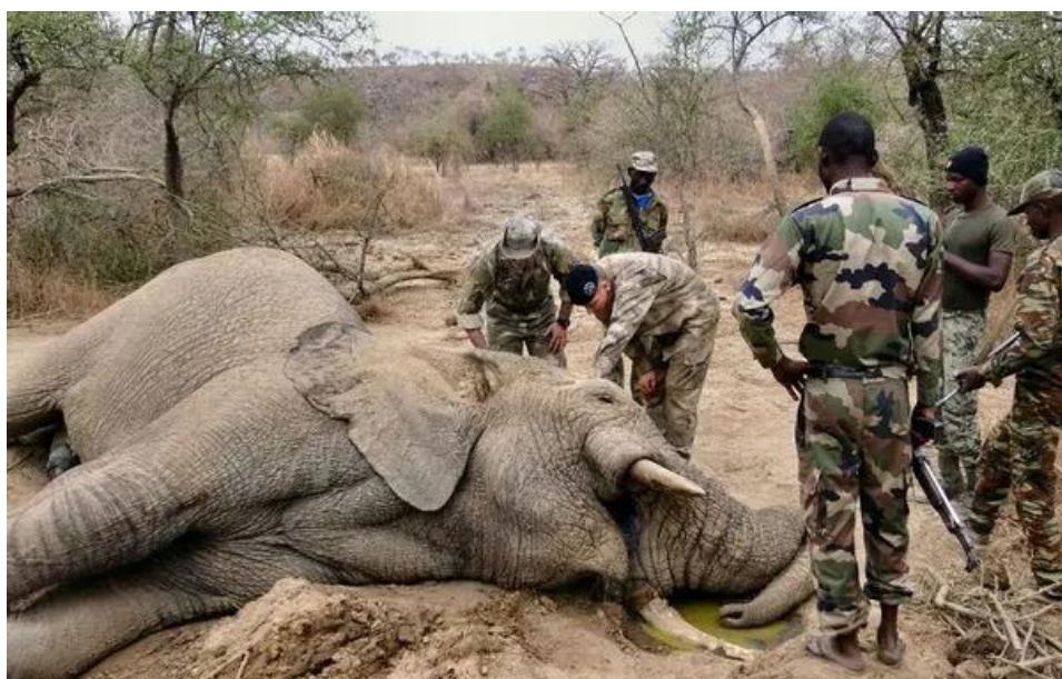
Cette photo est choquante et montre ce que subissent les animaux (ici un éléphant) à cause de braconnage. On voit sur l'image l'éléphant mort et autour des hommes probablement des militaires.

En Afrique australe, le tourisme peut être vu comme une chance pour l'économie de la région et son ouverture sur le monde, ainsi que pour la protection du patrimoine naturel unique qui y vit. Mais pour autant, le tourisme est destiné seulement à une classe privilégiée, à défaut des populations locales, et les réserves naturelles sont touchées par du braconnage, jusqu'à des escalades de violences entre braconniers et garde-chasses. Mais ce taux de braconnage important est aussi un reflet des inégalités fortement présentes en Afrique australe depuis l'Apartheid. Celles-ci qui encourage certains habitants à tuer des animaux sauvages pour en vendre à un prix très élevé les parties prisées par le marché noir international (comme l'ivoire des éléphants dont la demande est forte en Asie du Sud-Est et au Moyen-Orient).