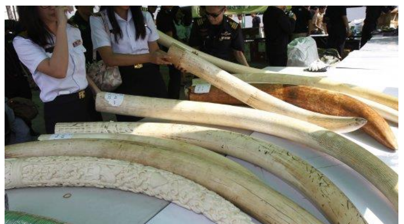
Les forces de sécurité ivoiriennes arrêtant deux trafiquants qui s'apprêtaient à écouler sur le marché noir 6 défenses d'éléphant.