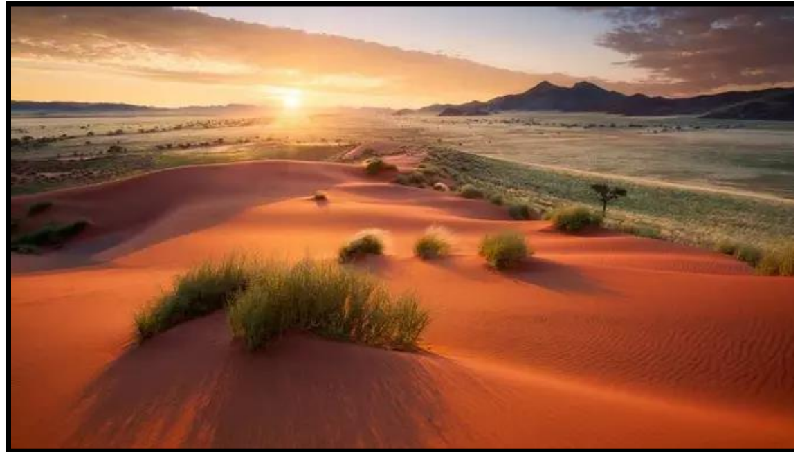
Cette photo nous désigne une plaine aride de Namibie qui évoque selon nous le patrimoine naturel de l'Afrique australe et sa richesse environnementale. Pinterest

L'Afrique australe comprend des pays comme le Botswana ou le Zimbabwe qui font partis des plus grands producteurs de diamants. Le rôle du diamant en Afrique australe est économique mais aussi culturel car c'est son exploitation par les Britanniques qui permis de développer le réseau ferroviaire le plus achevé du continent. C'est aussi sur la base de la localisation des richesses minières que s'est fait le découpage des pays de l'Afrique austral. C'est également sur les mines que s'est fondé le développement industriel qui fait de l'Afrique australe un cas particulier.