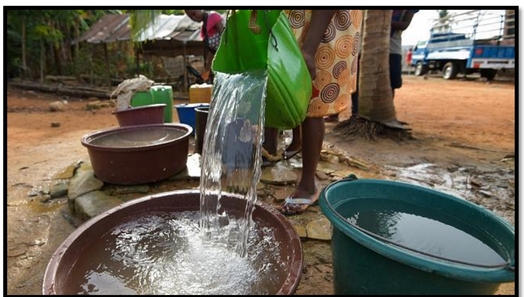
Photo de zimbabwéens s'approvisionnant en eau, une ressource en perte ...

Le fait que cette dictature, car on peut l'appeler ainsi, exploite de cette manière le trésor qu'elle possède, a de quoi désoler son peuple au travers de crises de guerres civiles, comme celles des « Blood Diamond » comme l'exprime si bien le film du même nom, mettant en scène Leonardo Di Caprio et Djimoun Hounsou .