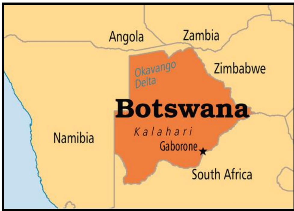
Carte régionale de l'Afrique australe. (Évasion online) et ci-bas une photo de mineurs zimbabwéens travaillant dans des conditions médiocres ( France tv info)