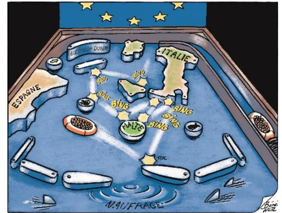
Caricature par Benedicte, Courrier International

Navire de l'ONG SOS Méditerranée, l'Aquarius a servi entre 2016 et 2018 avant d'être remplacé par l'Ocean Viking, toujours en action. Il mena de nombreuses opérations humanitaires dans le but de secourir un maximum de migrants des dangers du voyage et des risques de noyade. Elle fut l'objet de controverse, l'opposition considérant qu'elle encourageait plus de migrants à franchir les frontières.