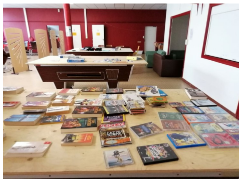
Zone de gratuité (Novembre 2018)