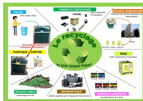
Document sur le recyclage au lycée créé par Mme Terré