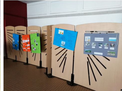
Affiches des élèves MPS