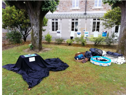
2nde9 : affiches sur la pollution des océans et matérialisation du 7ème continent