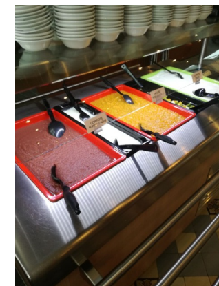
Bar à dessert : zéro plastique