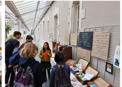
Intervenante sur le zéro déchet

Le projet sera poursuivi l'année prochaine. Il serait souhaitable que ce bilan soit présenté brièvement à l'ensemble du personnel lors de la journée de pré-rentree afin que les personnes intéressées puissent rejoindre l'équipe impliquée. Cela permettrait également de rappeler à tous les règles du recyclage au lycée.