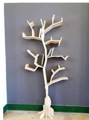
Arbre à livre réalisé par M. Morin