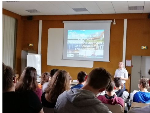
Conférence de l'École Centrale